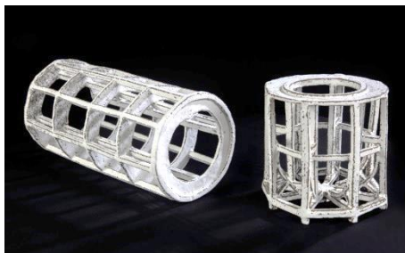
"Un par" Gres i coberta a 1180°C "Cascanueces" Gres i coberta a 1180°C